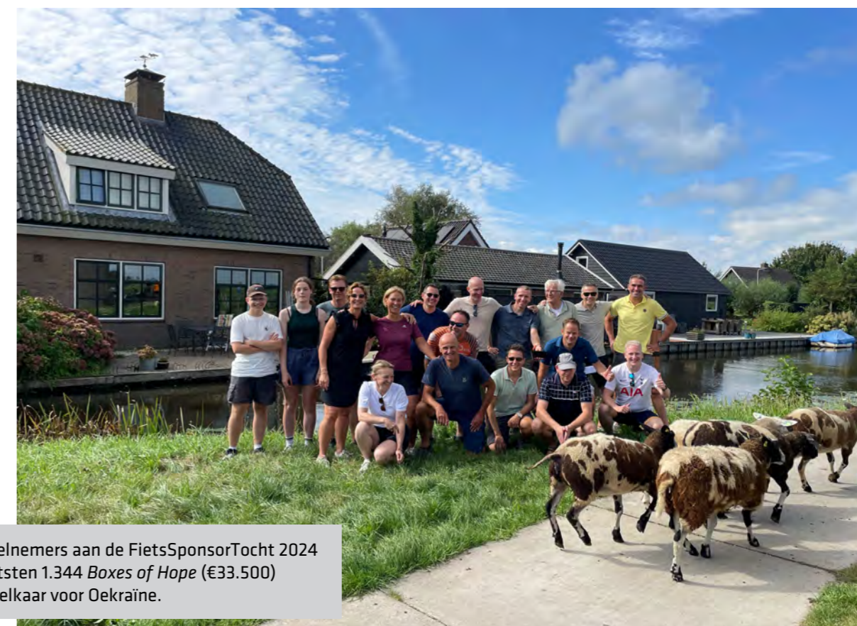
Deelnemers aan de FietsSponsorTocht 2024 fietsten 1.344 Boxes of Hope (€33.500) bij elkaar voor Oekraïne.

Klik hier om ons beleidsplan te downloaden