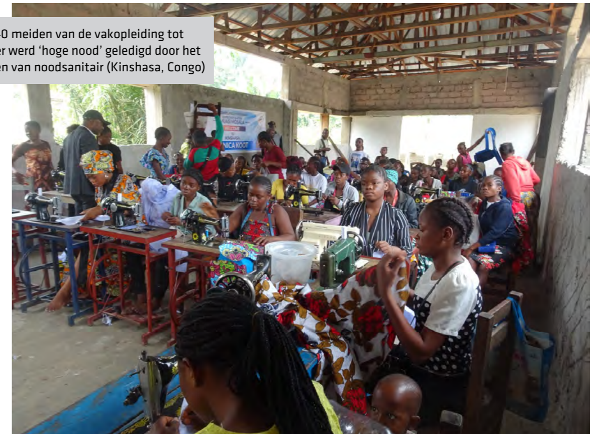
Voor 140 meiden van de vakopleiding tot naaister werd 'hoge nood' geledigd door het plaatsen van noodsanitair (Kinshasa, Congo)

Met MotivAction wil Stichting Hands & Feet zich vooral richten op het delen van verhalen van de mensen & projecten in binnen- en buitenland, waarvoor Hands & Feet zich inzet. Het delen van hun passie en motivatie en daarmee aanzetten tot actie. De FietsSponsorTochten zijn daar een mooi voorbeeld van.