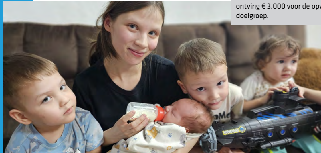
Een moeder-kind huis in Omsk (Rusland) ontving € 3.000 voor de opvang van deze doelgroep.